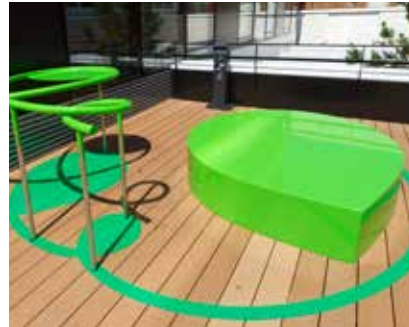
Nathalie Elemento, Espace commun , 2017, © Augusto da Silva

Technique : acier peint, galvanisé 20/10e.