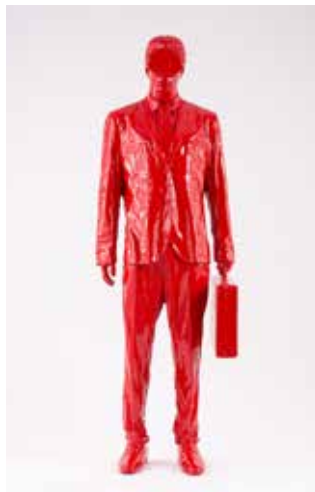
James Colomina Le Voyageur , 2020

Technique : sculpture d'après modèle résine, dimensions 187 x 60 x 46 cm, version aluminium AS7G