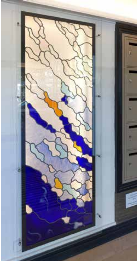
Patrick Forfait, L'eau et l'air , 2018

Technique : Vitrail : verre soufflé à la bouche. Sertissage : étain et plomb. Dimensions : 60cm de large sur 2 m de haut.