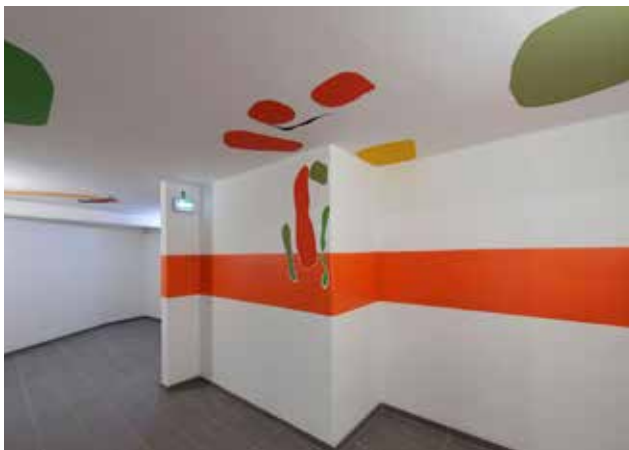
Stéphane Calais, Les bosquets , 2019, © Augusto da Silva

« C'est un projet global de peintures murales, se déployant sur 6 niveaux, aux entrées et sorties des ascenseurs de parkings.