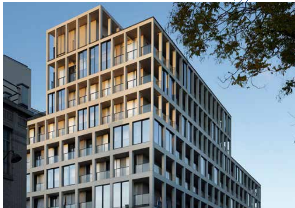
Ecoquartier des Batignolles – 75017 Paris