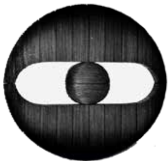
Pierre Riba, In the Middle , 2015

Technique : carton cannelé, résine, poudre de graphite Dimensions : circonférence 1 m – épaisseur 12 cm