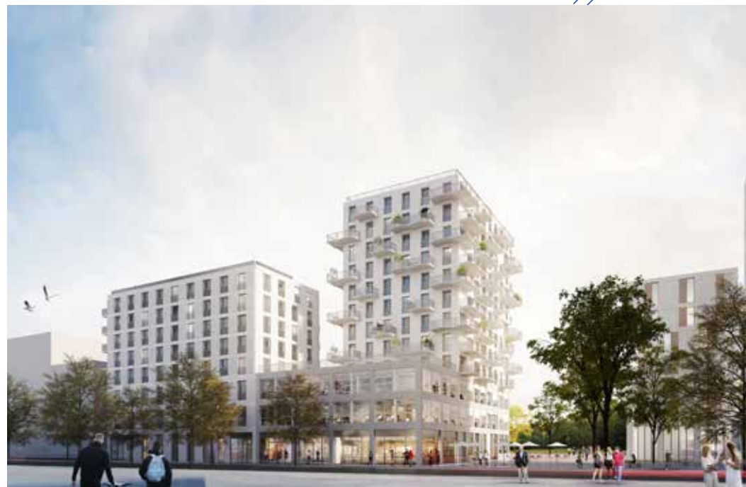
Prairie au Duc – Île de Nantes