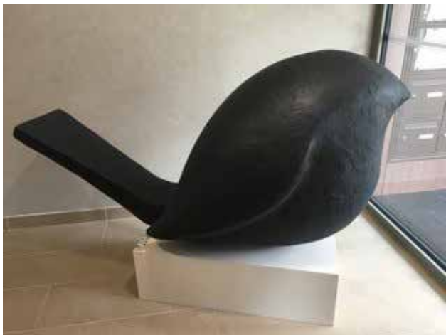
Chantal Blanchy Oiseau , 2017

Technique : Résine Dimensions : 80 x 160 x 75 cm