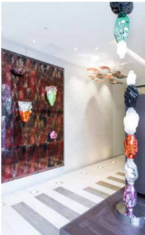
Aristide Najean, La Colombes Serenissima 2019

Technique : Pièces et formes sculpturales inspirées de détails et d'effets de cascades, de roches ainsi que de blocs soufflés à Murano