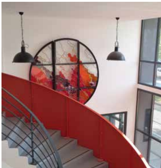
Patrick Forfait Le feu et l'air , 2018

Technique : Verre soufflé à la bouche St Just-St Gobain Armature fer Sphère de 2.50 m