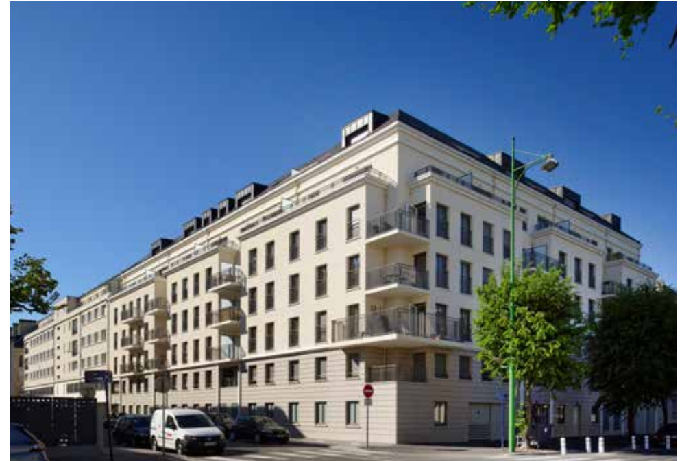
21 rue de la Miséricorde et 11 rue des Carmes - 14000 Caen

« L'eau et l'air » est un clin d'œil au bassin de plaisance qui se trouve à proximité de la résidence réalisée par Marignan. » Patrick Forfait