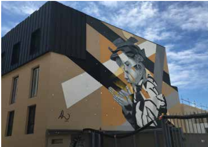
AL, Diffraction 2019

Technique : peinture acrylique et éclats de miroirs sur façade