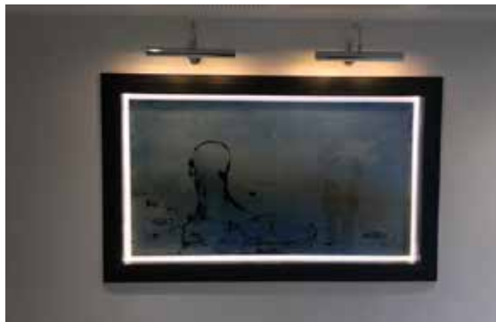
Agnès Pezeu, Entre ciels , 2019

« Mon travail met toujours en relation l'humain et la nature. Ici, l'homme scrute ce paysage où la mer côtoie l'infini. » Agnès Pezeu