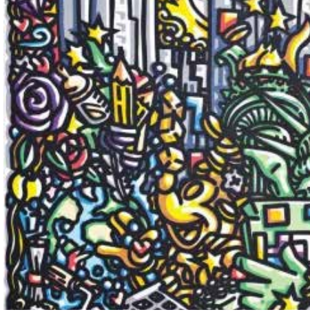
Jakè, Les Loges , 2016 © Bernard Laurent

Technique : Marqueurs acryliques sur toile